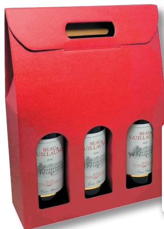
Étui carton 3 bouteilles coloris bordeaux (30p minimum/commande) 1,40 €