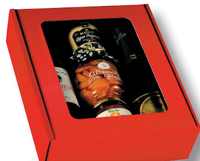
Coffret carton 3 bouteilles Rouge à fenêtre (40p minimum/commande) 2,90 €