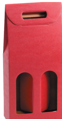
Étui carton 2 bouteilles coloris bordeaux (30p minimum/commande) 1,20 €