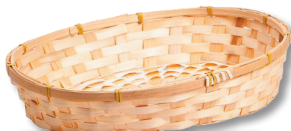
Corbeille Bambou ovale naturel 2,90 €