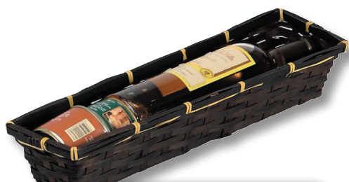
Corbeille Bambou Chocolat 1,80 €