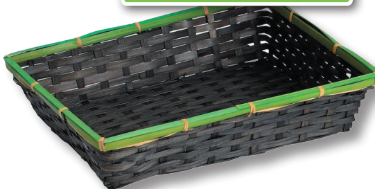
Corbeille Bambou rectangulaire gris/vert 2,30 €