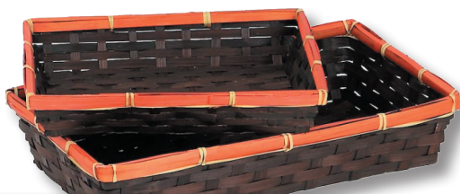
Corbeille Bambou rectangulaire chocolat/orange 2,60 €