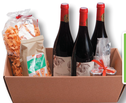
Corbeille Carton coloris kraft (50p minimum/commande) 1,40 €